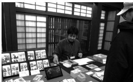
実習風景（かるた作り）

初日の16日は401名、二日目の17日は366名で、合計767名の方にご来場いただきました。秋の観光シーズンの最中であり、観光客の来場も多くみられた。海外からの観光客も来場者の2割ほどを占めるなど、国内外の多くのお客様に、和のしつらいの中で、京都の伝統産業の魅力を効果的に伝える機会とすることができた。