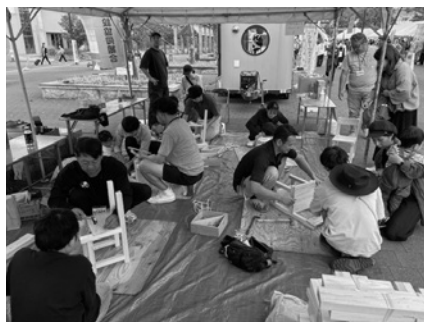
ミニ椅子づくり体験