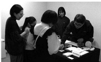
実習風景（印章彫刻）