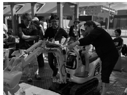
ミニショベルカー体験