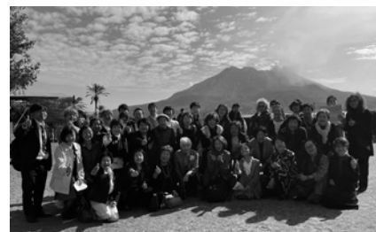
2日目エクスカーショ 桜島をバックに記念撮影