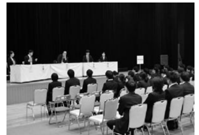
アフターセッション