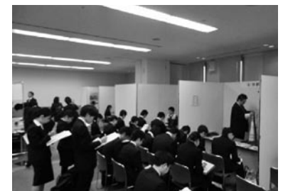
Work in KYOTO (第6回合同企業説明会)