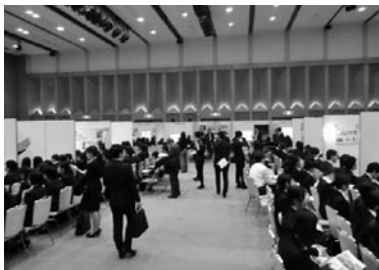
テルサホールにおける合同企業説明会