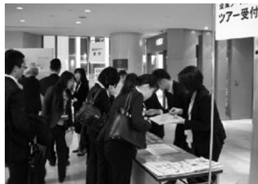
企業ブース訪問ツアー