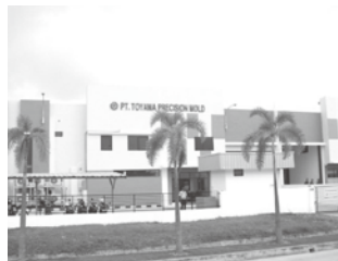
「PT.TOYAMA PRECISION MOLD INDONESIA」 外観