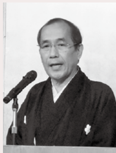
祝辞：京都市 門川市長