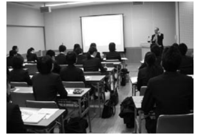
就活セミナー「魅力的な中小企業の見つけ方・見分け方」