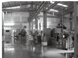
「PT.TOYAMA PRECISION MOLD INDONESIA」 内部