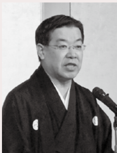
祝辞：京都府 山田知事