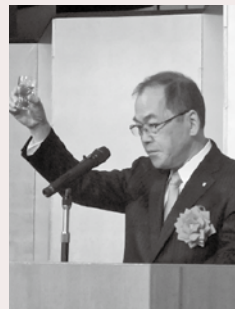
乾杯：京都銀行協会 高崎会長