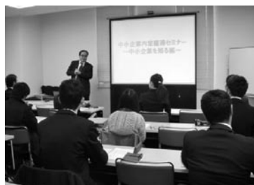
中小企業120%理解セミナー

午後からは、昨年7月から毎月実施してきた「就活7(セブン)」の第6回合同企業説明会として、166名が参加し、20社の企業ブースを訪問した。